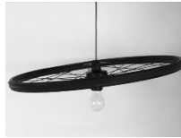
Van niets iets maken!

Ik ben van mening dat je naast de lessen enorm veel leert in de praktijk. Je leert werken in een team maar ook zelfstandig. In de lessen kregen we naast de theorie ook veel praktijk. Kortom, wat ik geleerd heb van de opleiding is toch wel werken voor een opdrachtgever, van niets iets maken en ontwikkelen van de creativiteit.